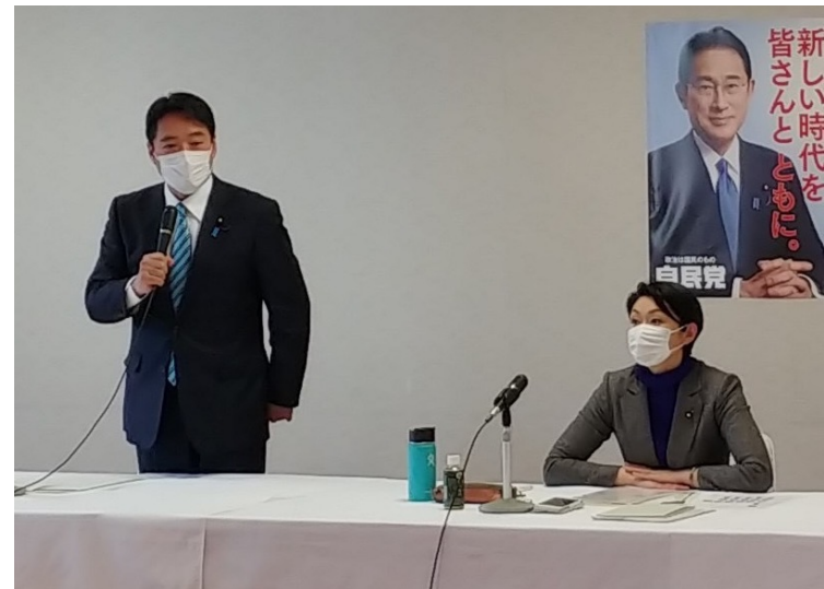
組織運動本部・地方組織・議員総局役員会

ガバナンスコード策定PTの委員として出席。地方組織との政策対話強化が柱の一つになる中、私もしっかりと検討を深めていきます。