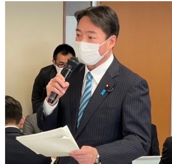
総合農林政策調査会・農林部会