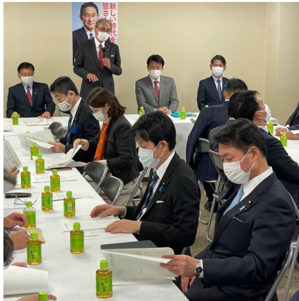
憲法改正実現本部憲法改正 ・国民運動タスク・フォース会議

・ 安芸市、高知市、須崎市、南国市、土佐市、香美市の市長さんから特別交付税要望を伺いました。 総務省に向けて要望をしっかりと繋いでいきます！