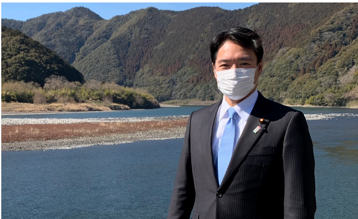
四万十市、佐田の沈下橋にて

国際協力調査会事務局次長を拝命していることから、国際協力のあり方について勉強を重ねています。厳しい国際環境、安全保障環境を踏まえて、国際協力のあり方をどう考えるか、今後も勉強・議論を重ねます。